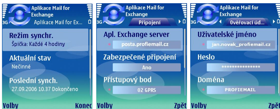
Úvodní obrazovka aplikace